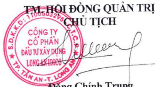
Đặng Chính Trung